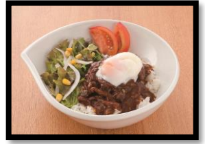
岡本太郎美術館特別メニュー イメージ(カフェテリアTARO デミハンバーグポウル) ※ソースはデミグラス又はトマトから お選びいただけます