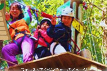
フォレストアドベンチャーのイメージ