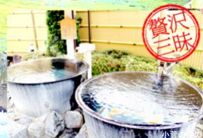
小管の湯のイメージ