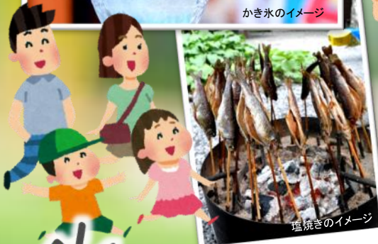
塩焼きのイメージ