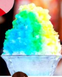
かき氷のイメージ