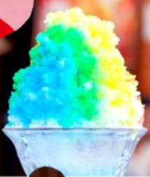
かき氷のイメージ