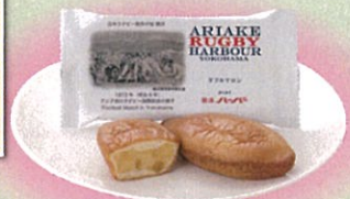
「ありあけ」のラグビーハーバー付き!