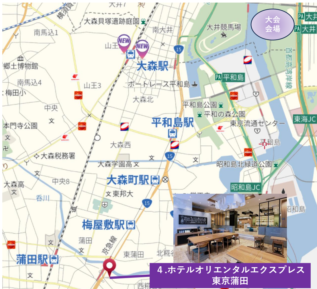
4. ホテルオリエンタルエクスプレス 東京蒲田