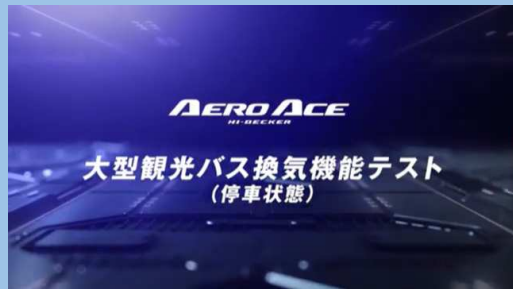
換気機能テスト（停車状態）