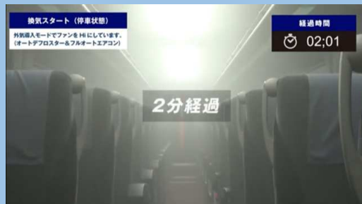
2分経過 （外気導入モードHI）