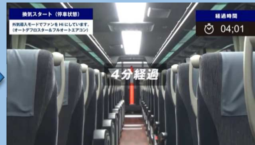
4分経過 （外気導入モードHI）