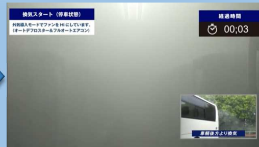
換気スタート （外気導入モードHI） 車両後方より強制排気