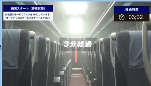
3分経過 （外気導入モードHI）