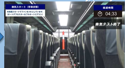
換気テスト終了 （約5分前後にて空気の入替 が終了）