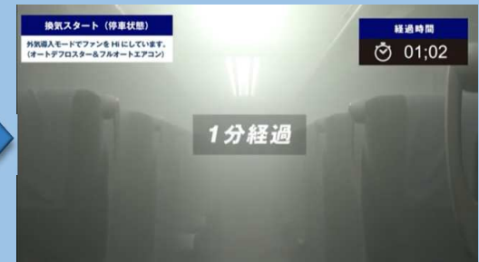
1分経過 （外気導入モードHI）