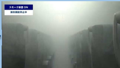
スモーク装置ON （換気機能停止）